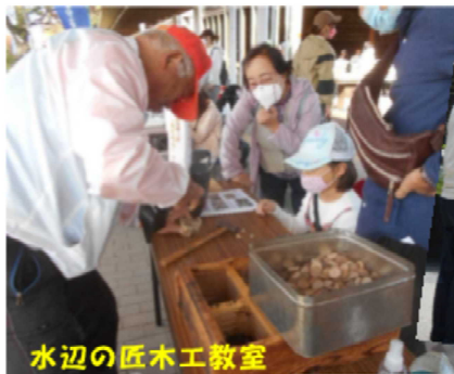
水辺の匠木工教室