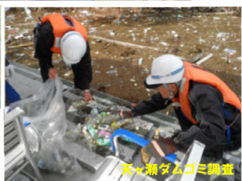
天ヶ瀬ダムゴミ調査

コロナ禍で活動に制約をうけており、これまでの活動の一部をご紹介します 現在は毎月10日の瀬田川清掃、25日の高橋川清掃が主な活動です