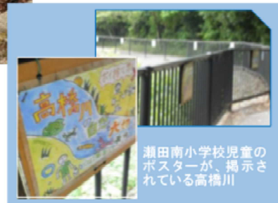
湖田南小学校児童のポスターが、掲示されている高橋川