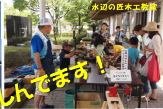
水辺の匠木工教室