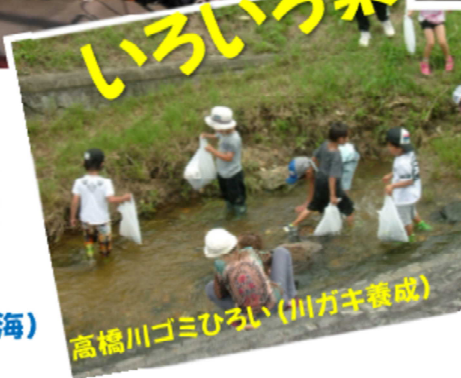
高橋川ゴミひろい(川が主養成)