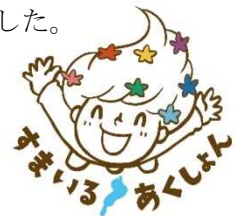
普及啓発事業の例（すまいるアクションフェスタ2021）