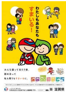
ポスター（人権週間編）