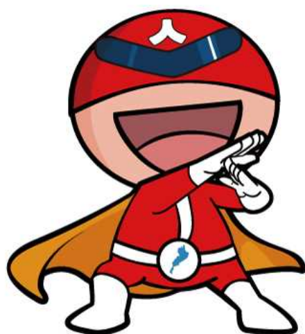
滋賀県人権啓発キャラクター ジンケンダー