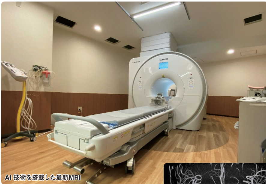
AI 技術を搭載した最新MRI

この度、当院では2台あるMRIのうち1台(1.5T)を最新の装置に入れ替えました。