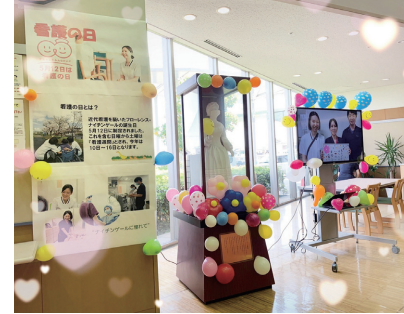
看護の日(総合受付の様子)