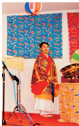
沖縄にはまっています

さんと3人組のきいやま商店のコンサートは、行くたびにリフレッシュできます。写真は、市販のものを真似て作ったハブとマンガースとヤシガニです。時々きいやま商店のコンサートに持参し、一緒に踊ってエネルギーチャージしています。