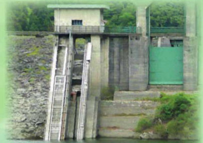
ダム堤体と紅白の桜

※ダムマイスターとは、(財)日本ダム協会が任命するダムの知識が豊富な方をいいます。ダムの役割や魅力などについて一般の方々に広く知っていただくための支援をする役割を担っていただいています。