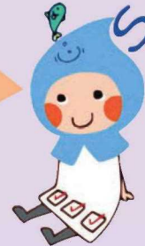
事前放流のしくみ

すごい大雨の前には ダムの水を減らして たくさん水をためられる ようにするんだね