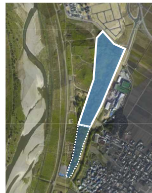
地理院地図より作成