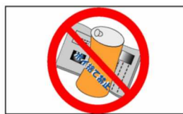
ゴミの散乱、ポイ捨て禁止