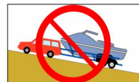
斜路等に放置禁止、白線内に駐車