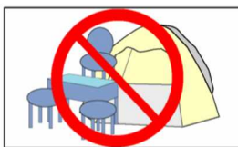
テント、イス等は禁止