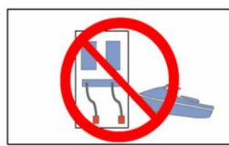
斜路内等での給油禁止