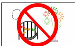
花火、バーベキュー等禁止