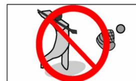
ゴルフ、キャッチボール等球技禁止