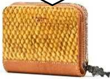
「ウィード・ダイコレクション」