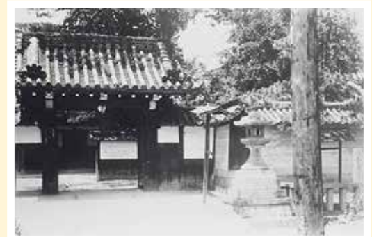
近松御坊顕證寺(大津市)