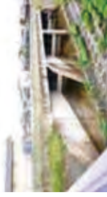
新守山川吐出口 (守山市三宅町)