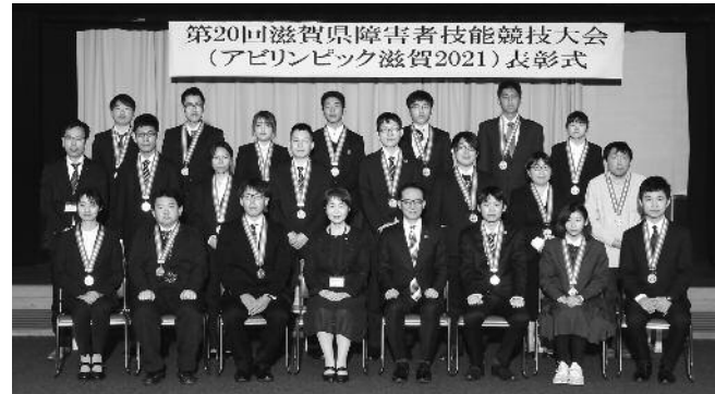
令和4年1月26日（水）表彰式（東館7階大会議室）

なお、今大会の結果により今年11月4日（金）から6日（日）に千葉県で開催される「第42回全国アビリンピック」へ出場する選手が選考されます。