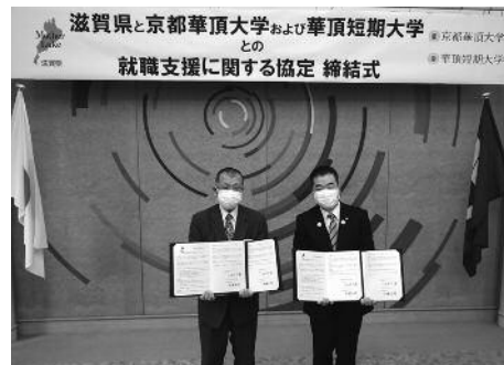
(左から) 中野学長、三日月知事

【お問合せ先】 滋賀県商工観光労働部労働雇用政策課 TEL：077-528-3759