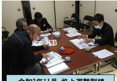
令和2年11月 机上避難訓練