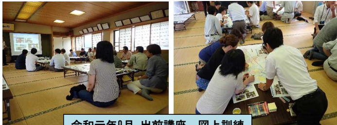
令和元年9月 出前講座、図上訓練