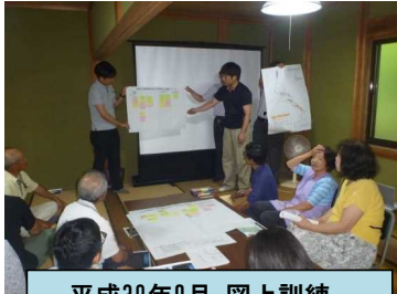
平成30年9月 図上訓練