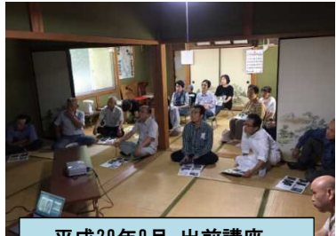
平成29年9月 出前講座