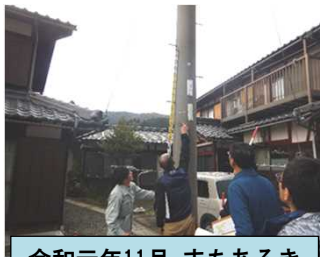
令和元年11月 まちあるき