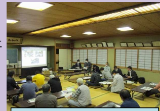
令和3年11月 住民説明会