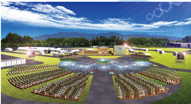
▲開催イメージ図 (甲賀市「鹿深夢の森」)

豊かな国土の基盤である森林・緑に対する国民的理解を深めるために開催する国土緑化運動の中心的行事です。昭和25年(1950年)の第1回大会以来、例年春に各都道府県をまわり開催されており、滋賀県での開催は47年ぶりです。