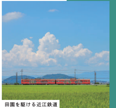
田園を駆ける近江鉄道