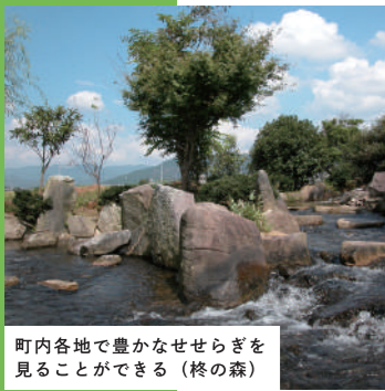
町内各地で豊かなせせらぎを見ることができる(終の森)