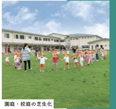
園庭・校庭の芝生化