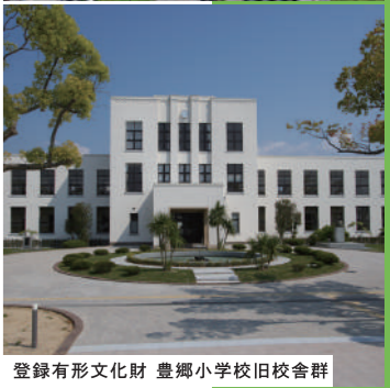
登録有形文化財 豊郷小学校旧校舎群