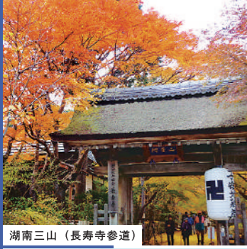
湖南三山（長寿寺参道）