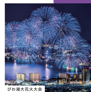
びわ湖大花火大会