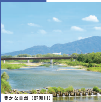
豊かな自然（野洲川）