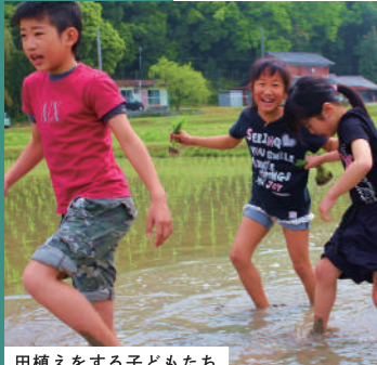
田植えをする子どもたち