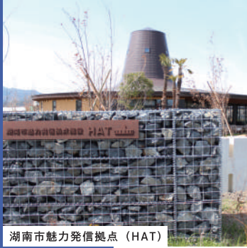
湖南市魅力発信拠点（HAT）