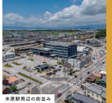
米原駅周辺の街並み