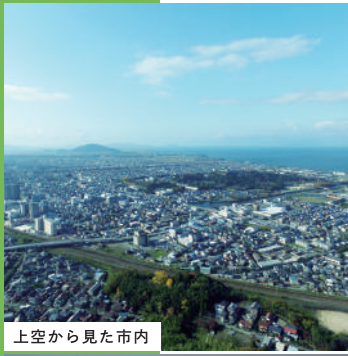
上空から見た市内