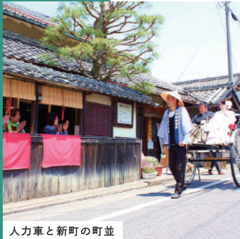
人力車と新町の町並