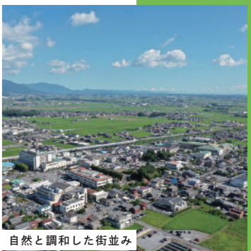
自然と調和した街並み