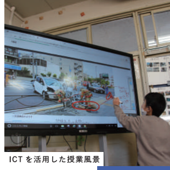
ICTを活用した授業風景