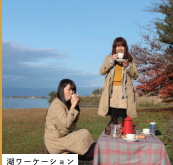
湖ワーケーション