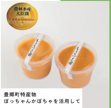
豊郷町特産物 ほっちゃんかぼちゃを活用して