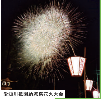
愛知川祇園納涼祭花火大会