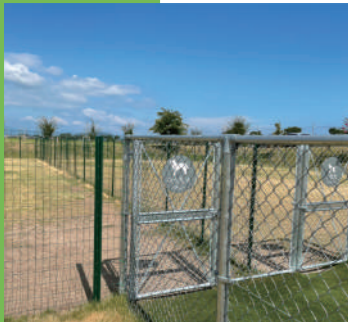
道の駅にあるドッグラン