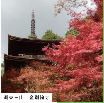
湖東三山 金剛輪寺