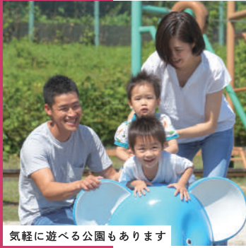
気軽に遊べる公園もあります