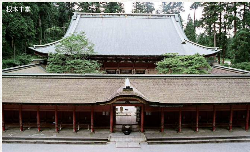
根本中堂は現在改修中です

国宝の根本中堂並びに重要文化財の廻廊を平成二十八年度から約十年かけ大改修を行っています。今回の視察では、比叡山延暦寺の僧侶による根本中堂の特別な案内・説明や、約1700haにもおよぶ延暦寺所有林の山林経営についてもご説明頂きます。普段立ち入ることのできない工事用の足場に入り、間近で巨大な木組みや装飾をご覧頂くことができます。この機会に是非ご参加ください。