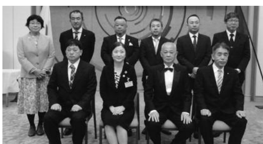
▲「おうみの名工」表彰受賞者