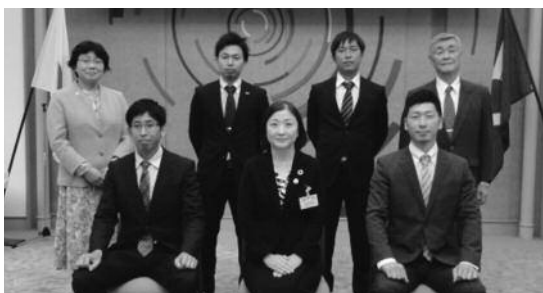
▲「おうみ若者マイスター」認定者