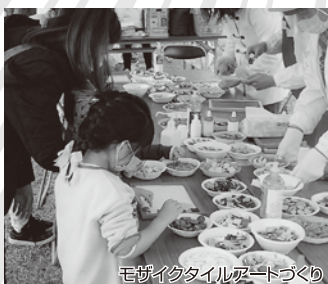
モザイクタイルアートづくり