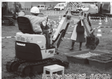
ミニバックホウでボールすくい