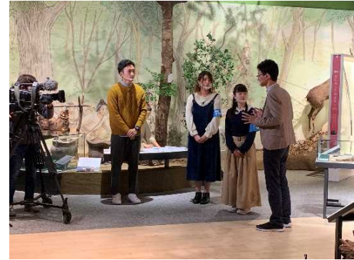
R2 県広報番組収録風景

滋賀県は若いみなさんの視点を求めています! 青少年広報レンジャーになって、 様々な現場を体験・レポートしてみませんか? 活動を通じたみなさんの声が“明日のしが”を創ります!