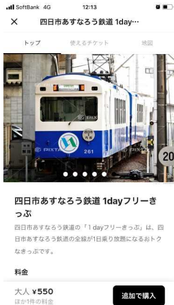
②購入するチケットを選択