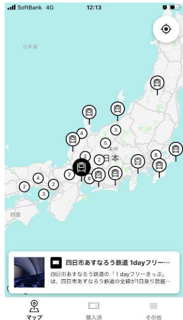
①利用したい交通機関を選択