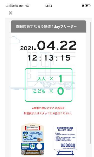
⑤利用時にチケットを提示