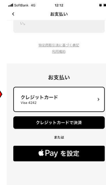
④クレジットカードまたはモバイルウォレットで決済