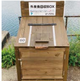
外来魚回収ボックス

⚠️ 釣上げた外来魚は、外来魚回収ボックス、外来魚回収いけすに入れてください。 ⚠️