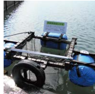
外来魚回収いけす