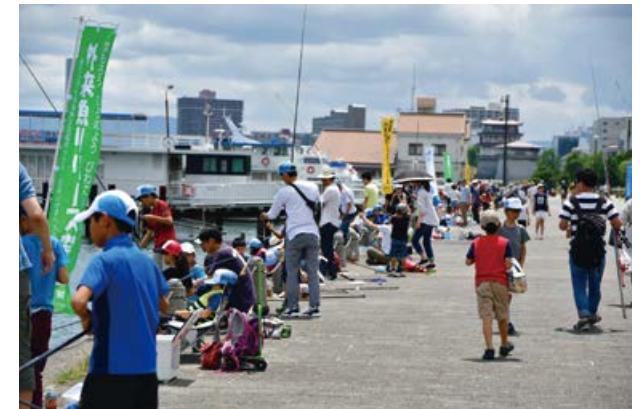
〈びわこルールキッズ釣り大会の様子〉