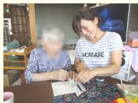
デイサービスの利用者様と

住み慣れた地域で高齢者の皆さまが、そのらしい生活ができるよう支援しています。また、スタッフがイキイキと働きやすい職場を提供することを心がけています。生き甲斐を感じる会社を一緒につくっていきませんか？専門的知識と技術及び倫理的自覚をもって、最善の介護福祉サービスが提供できる人材を求め、サポートしていきます。