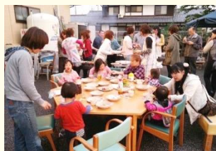
社員懇親バーベキュー