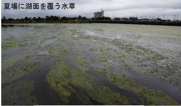
草津市北山田(令和元年10月8日)