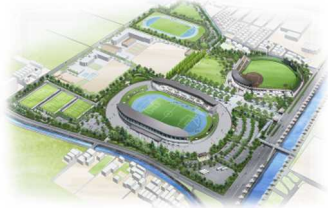
【広域防災拠点となる金亀公園】