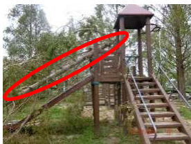
【倒木による遊具の損傷】

公園施設である樹木について、倒木対策として緊急的な更新(防除や伐木含む)への支援を！