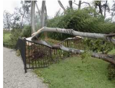
【倒木による施設の損傷】