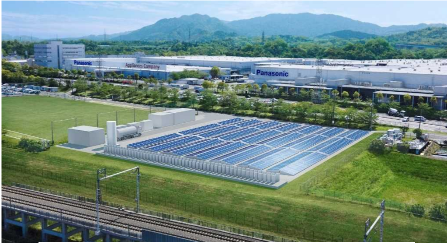
草津拠点 RE100 化ソリューション実証施設完成イメージ

パナソニック株式会社（以下、パナソニック）は、純水素型燃料電池と太陽電池を組み合わせた自家発電により、事業活動で消費するエネルギーを100%再生可能エネルギーで賄う「RE100 化ソリューション」の実証に取り組みます。本格的に水素 ※2 を活用する工場の RE100 化は、世界で初めて ※1 の試みとなります。