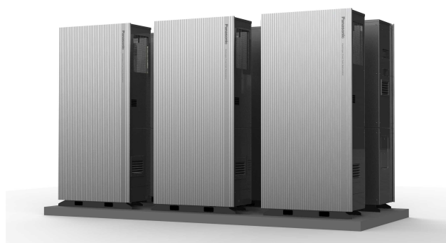
純水素型燃料電池 連携制御イメージ

実証に用いる当社製の純水素型燃料電池は、家庭用燃料電池コージェネレーションシステム「エネファーム」で培った技術を活用して開発したものです。コンパクトな筐体で発電効率が高いことに加え、複数台の連携制御により需要に応じた発電出力のスケールアップが可能であるほか、屋上や地下室、狭小地など柔軟な設置に対応します。