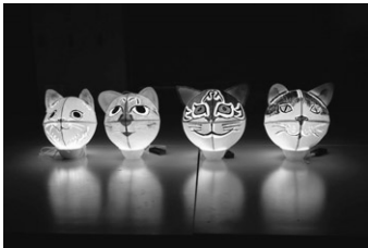
制作された猫ねぶた

「猫十動物」をテーマにした三年に一度の祝祭(動物に感謝し、生きることを喜び、ロカルなコミュニティを一緒に育てるアートでクリエイティブ