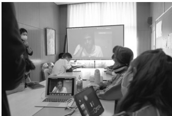
アニメーション・ワークショップの様子