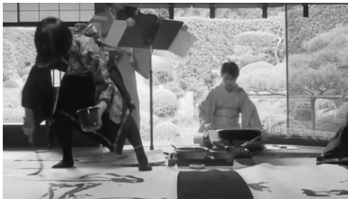
② 書と舞と音のコラボレーション