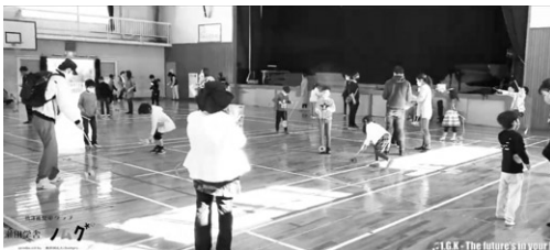
④ 子どもの夢づくり支援プロジェクト