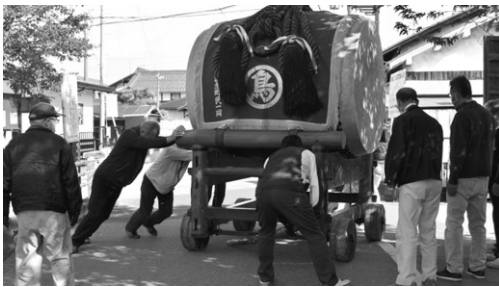
③ 高宮お祭り体験教室