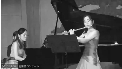
① 能楽ホールでのフルートとピアノのコンサート

新型コロナウイルス感染症の影響により、県内での展覧会や公演が中止・延期となるなど、文化芸術活動の機会が失われています。このため、県では、県民や芸術家の方々が文化芸術活動を再開するための費用を支援する「未来へつなぐしが文化活動応援事業」を実施し、対象となる文化芸術