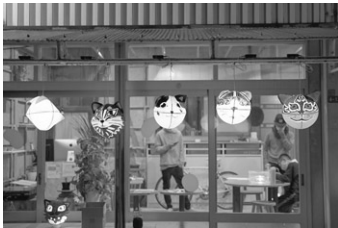
お店に飾られた猫ねぶた