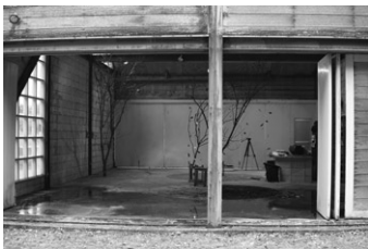
環境整備中の旧青少年自然道場