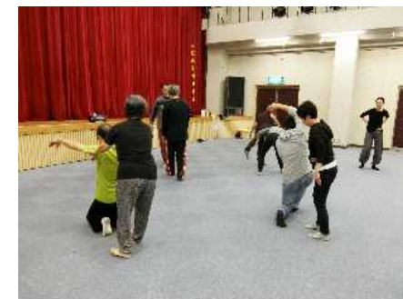
近江八幡文化会館で実施されたダンスワークショップ “からだで遊ぼう”の様子