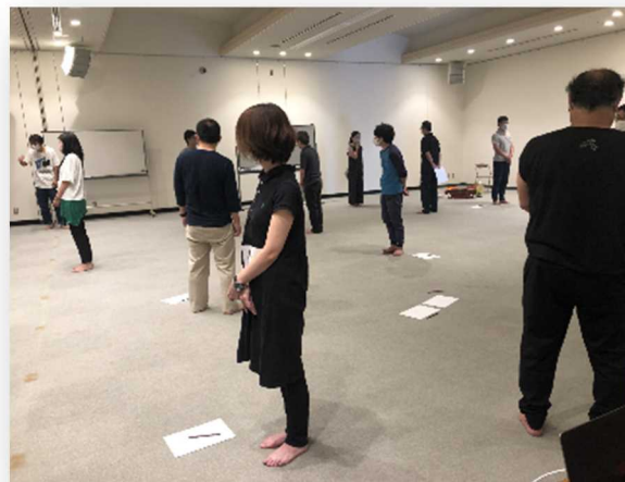
福祉と芸術をつなぐ ラウンドミーティング in島根での様子

福祉事業者と、劇場・音楽堂等関係者や文化振興財団等と一緒に、連携や協働のあり方を考えるための研修の実施。