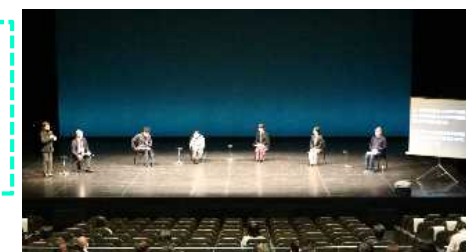
びわ湖ホールで実施した障害者による文化芸術活動推進のための人材育成研修会の様子