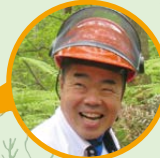
滋賀県知事 三日月 大造

13:00 表彰等セレモニー 13:40 トークセッション 14:20 記念植樹 (広場周辺部) チェーンソーアート実演会 (広場内)