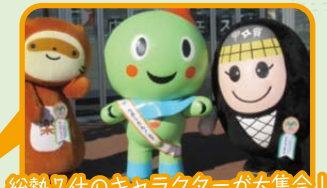
総勢7体のキャラクターが大集合! 会場をゆる〜く盛り上げます。

11:00 びわ湖の日40周年PRステージ 11:30 記念伐採 12:00 丸太のベンチづくり競技会 (広場内) クイズ大会 & 記念撮影会withご当地キャラ達 (ステージ)