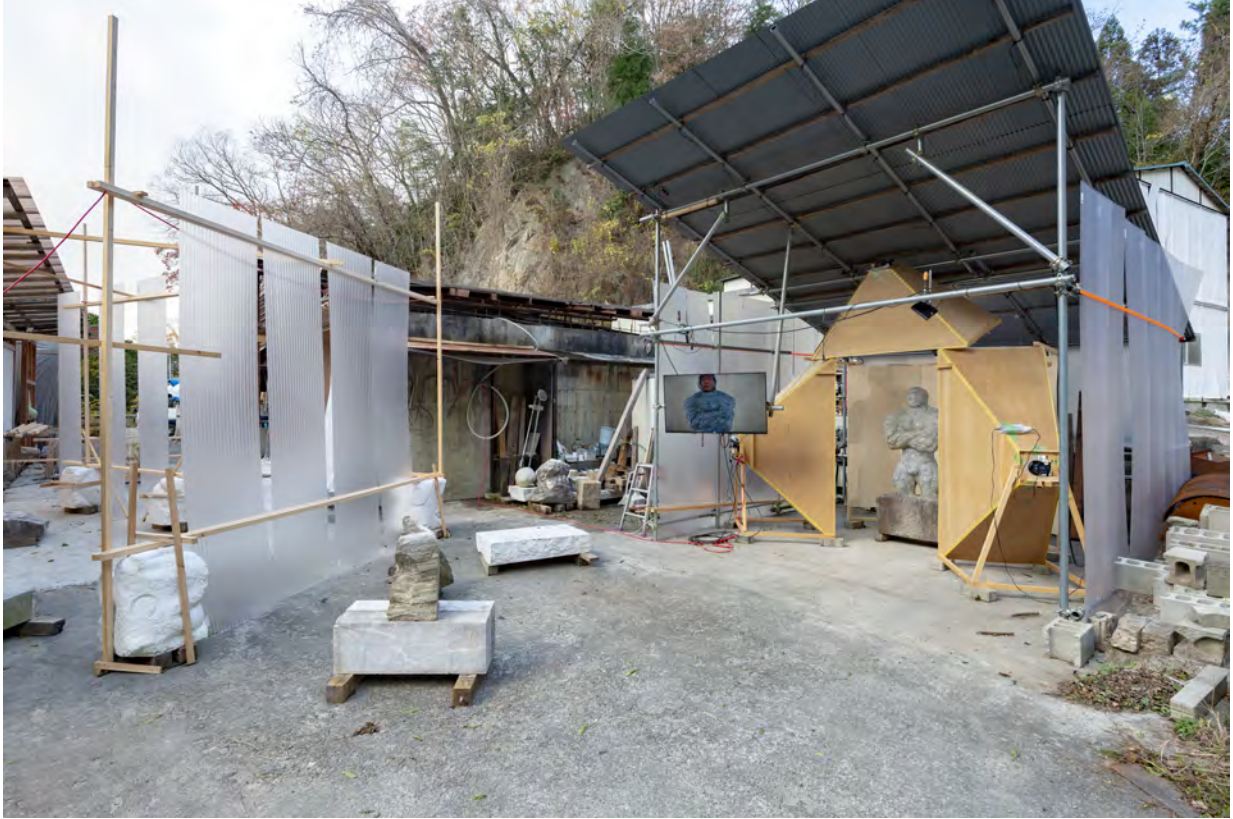
・ 入り口から見た画像