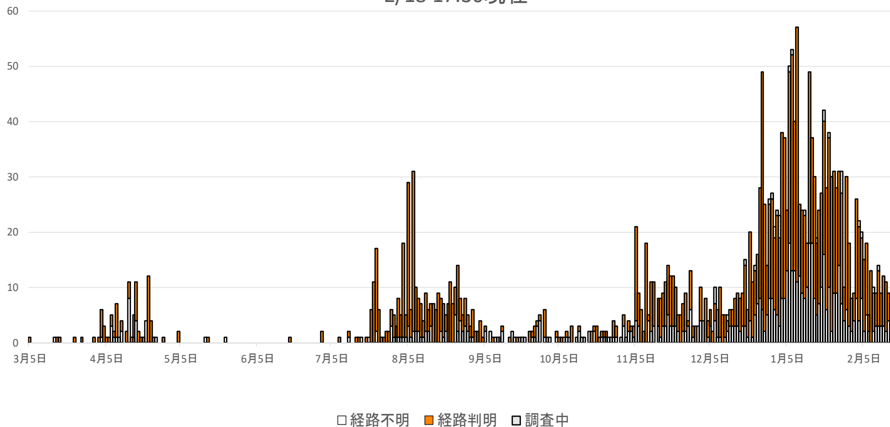
新型コロナウイルス感染の流行曲線(公表日別) 2/18 17:30現在