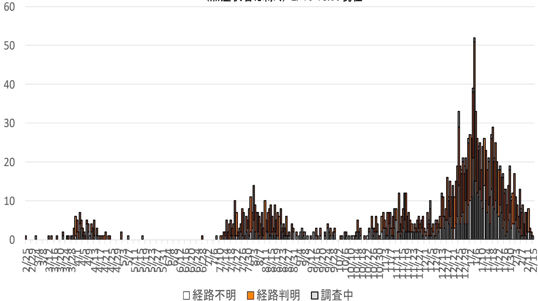
新型コロナウイルス感染症の流行曲線（発症日別） （無症状者は除く）2/16 18:00現在