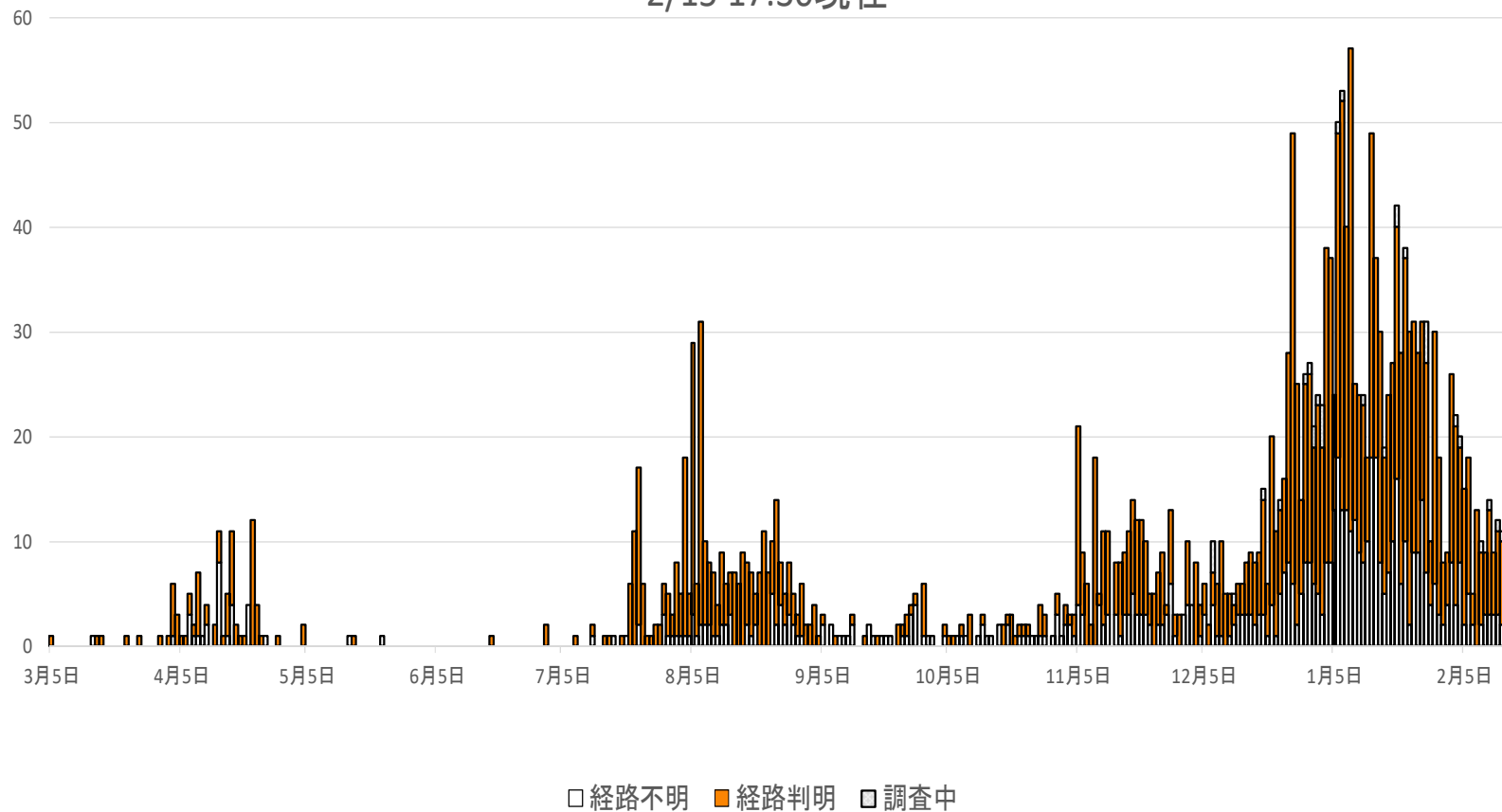
新型コロナウイルス感染の流行曲線(公表日別) 2/15 17:30現在