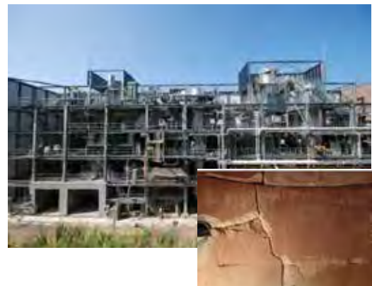
図 3. 東北部浄化センター 焼却炉 (耐火煉瓦クラック)