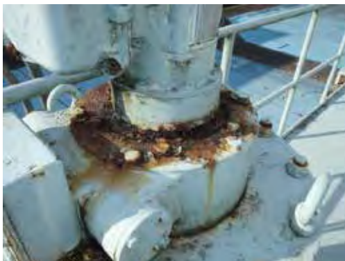
図 2. 湖南中部浄化センター No. 1 汚泥掻寄機 (腐食)

琵琶湖流域下水道は昭和 57 年より湖南中部で供用を開始し、すでに 30 年以上経過した設備もあり、施設全体の老朽化が進行しています。老朽化した設備は、順次改築更新する必要があります。