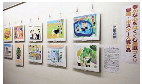
「豊かな心をはぐくむ家庭づくり」 絵画・ポスター入選作品掲示