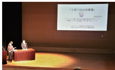
真野北学区青少年育成 学区区民会議