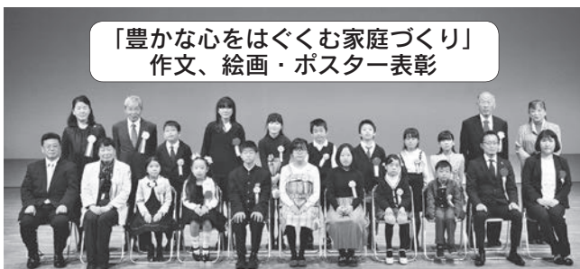
「豊かな心をはぐくむ家庭づくり」 作文・絵画・ポスター表彰