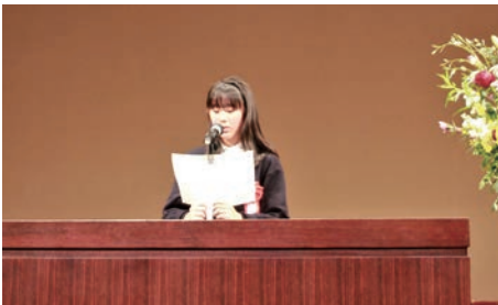
最優秀作文の発表