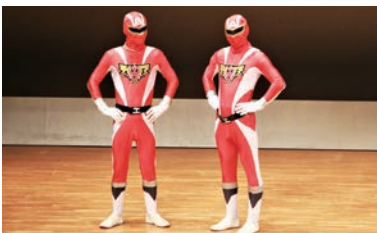
東近江市商工会青年部 商工戦隊「赤レンジャイ」