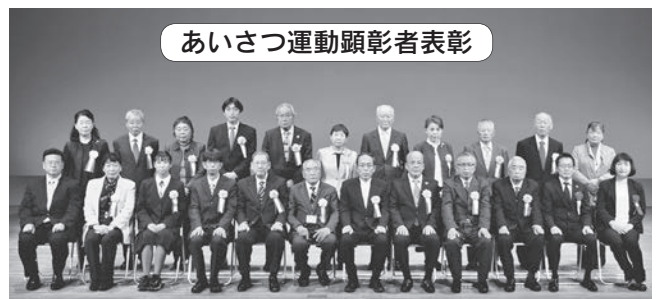
あいさつ運動顕彰者表彰