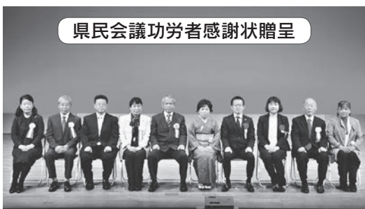
県民会議功労者感謝状贈呈