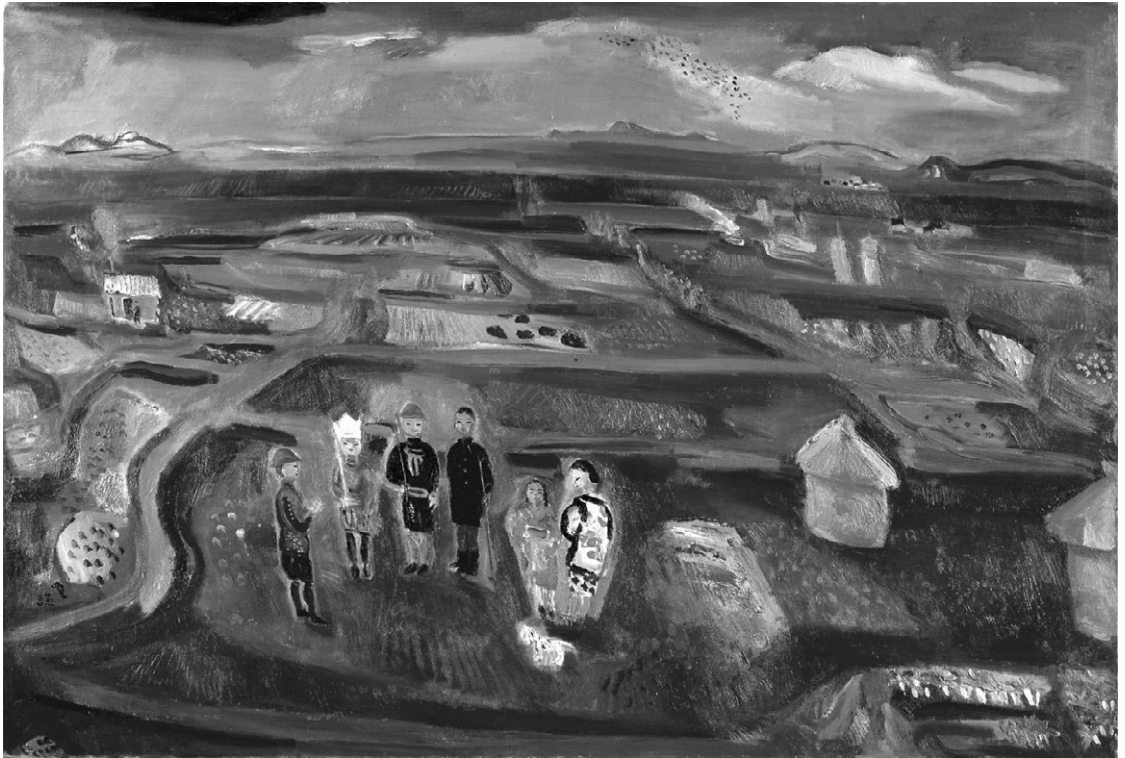
野口謙蔵「冬田と子供」 昭和14(1939)年 油彩・画布 縦130.0×横193.4(cm) 滋賀県立近代美術館蔵