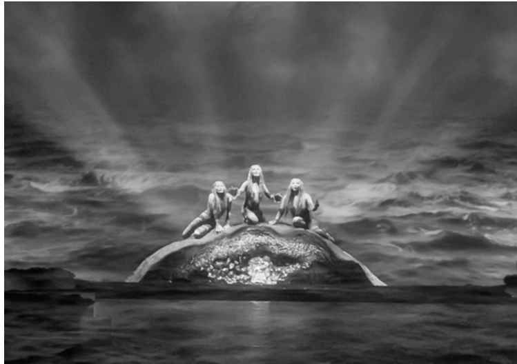
びわ湖ホールプロデュースオペラ「神々の黄昏」 公演(2020年3月)

か「鶴の恩返し」的な印象も受ける、中世の伝説に基づいて書かれた作品です。ワーグナーはこのお話に、名曲の宝庫とされる魅力の詰まった大規模な管弦楽による音楽を付けました。第1幕への前奏曲、第3幕への前奏曲、婚礼の合唱といった曲は特に有名で、単独で演奏される機会も多い曲です。休憩を含めると4時間に及ぶ大作ですが、ワーグナーのおとぎ話の世界にどっぷり浸かってみませんか。