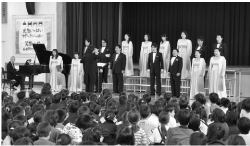
学校巡回公演（2019年5月）

だけのプログラムをご用意しましたので、たくさんの方のお越しを心よりお待ちしております。なお、びわ湖ホールでの公演はYouTubeによるリアルタイム配信およびアーカイブ配信を無料で行います。