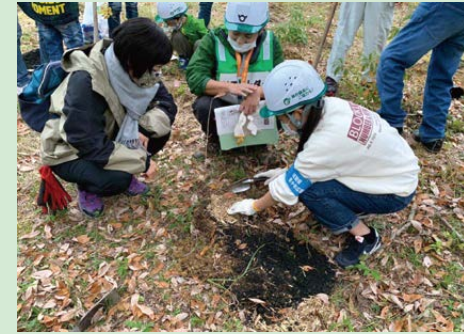
山道を登り、植樹は穴掘りから行いました。参加者は息が上がりながらも充実した様子でした。

11月22日には甲賀市のみなくち子どもの森で県内のたくさんの方に加え、苗木のホームステイ参加者にも、自ら育てた苗木を滋賀の森に植えていただきました。さらに、丸太切り体験や、世界に1つのオリジナル製品の木工など、県内の小学4年生が体験する森林環境学習「やまのこ」の一端にふれ、秋の森を満喫いただきました。今後のイベントにもご期待!