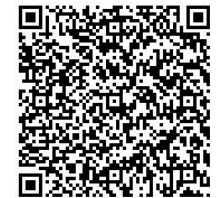
QR コードは (株)デンソーウェーブ の登録商標です。

■ 景 品 ：抽選で 30 名におもしろ防災グッズをプレゼント※当選発表は発送に代えさせていただきます。