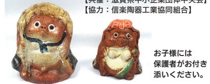
【共催: 滋賀県中小企業団体中央会】 【協力: 信楽陶器工業協同組合】