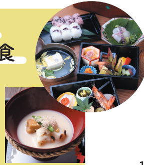
*お料理写真はイメージです。