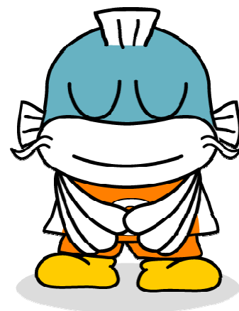
滋賀県の イメージキャラクター キャッピー