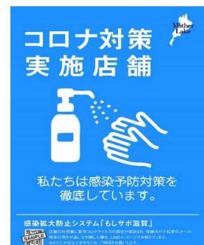
感染予防対策実施宣言書 (滋賀県ホームページからダウンロードできます。)