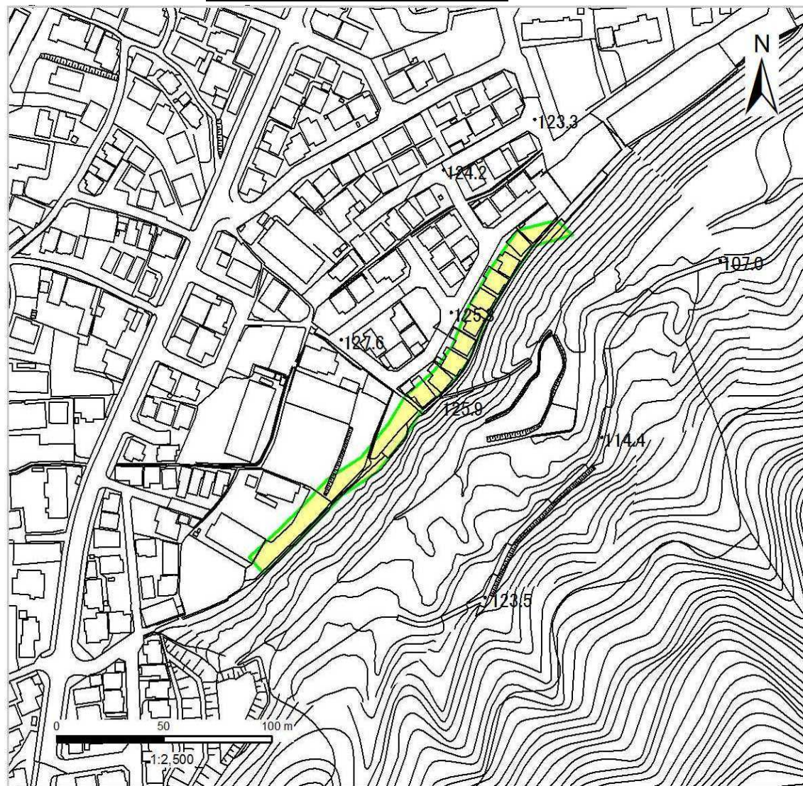
土砂災害警戒区域 区域図

○ この区域図は、空中写真測量による地形図に、実測による区域図を投影したものであり、一部異なって見える場合があります。 詳しくは、土木事務所にお尋ねください。