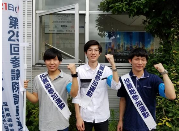
第2回 第25回参議院議員通常選挙 県内一斉街頭啓発