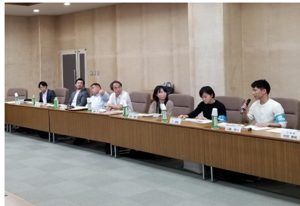
第7回 介護のイメージアップ施策検討部会