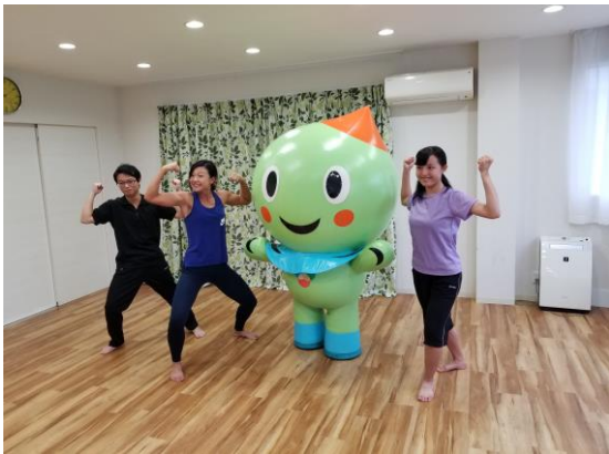
第6回 広報動画収録 (うおーたんの健康ストレッチ)