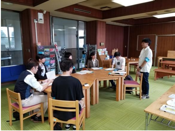
第1回 第1回ミーティング