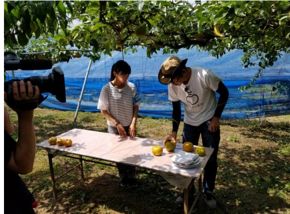
第4回 広報番組収録 ①(果樹)