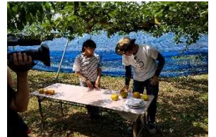
R1 県広報番組収録風景

滋賀県は若いみなさんの視点を求めています。 青少年広報レンジャーになって、様々な現場を体験・レポートしてみませんか? 活動を通じたみなさんの声が“明日のしが”を創ります!