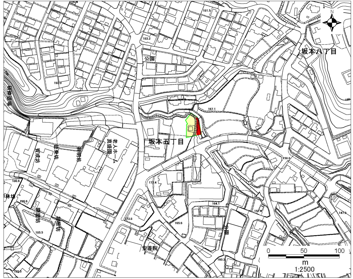
0 50 100 m 1:2500