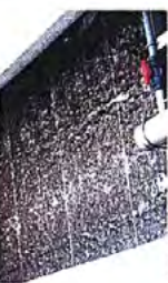
接触酸化施設内部

上澄み水は、接触材（プラスチック製の波板）の入った水筒内に流すことで、流盤に付着している微生物により分解されてきれいにされます。