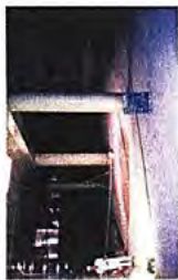
貯留沈殿施設内部

市街地排水を貯めて、砂や石子の大きな汚れを沈殿分離します。上澄み水は排酸施設などで浄化し、底に沈んだ汚れは流域下水処理場に入れて浄化センターで処理します。