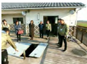
滋賀県 の 汚水 処理 技術 の 紹介