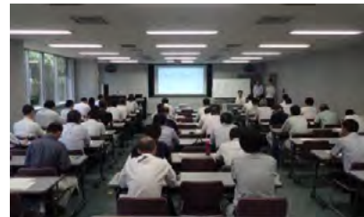
技術講習会の開催