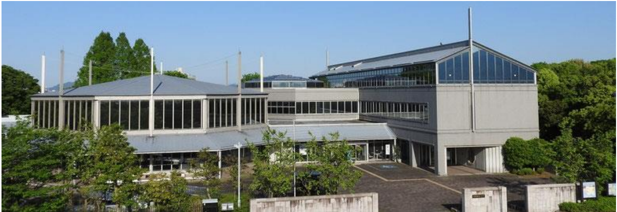
淡海環境プラザ外観

滋賀県では、下水処理技術の継承と発展を図り、一層の効率化や省エネルギー化を進めるため、下水処理技術の研究開発、普及促進、さらには、その成果を水環境ビジネスに繋げる拠点として、平成25年4月に、「淡海環境プラザ」(以下、プラザ)を矢橋帰帆島内に開設しました。