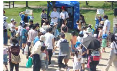
下水道イベントの開催