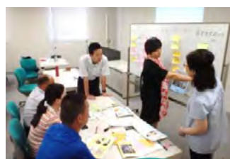
施設 の 維持 管理 マニュアル の 策定

滋賀県における先進的水環境保全の取組と、知識・技術と経験の集積という強みを生かした海外展開の取り組みが認められ、国土交通省より、水環境技術の海外展開に積極的な団体から成る「水・環境ソリューションハブ（WES Hub）」の構成地方公共団体として、平成26年3月28日に登録されています。