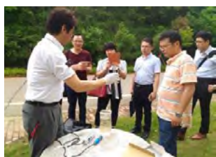
水質測定 の 指導

平成25年から令和元年6月にかけては、滋賀県と（公財）淡海環境保全財団が連携して中国湖南省における水環境改善プロジェクト（国際協力機構（JICA）草の根技術協力事業）を実施しました。このプロジェクトでは滋賀県がもっているノウハウや技術を紹介することで、湖南省の水環境改善に向けた取組を推進させることができました。