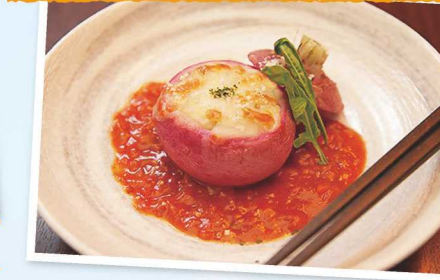
万木かぶと近江米のミートソースグラタン

「食」や「学び」を通して びわ湖もっと関わろう! ガイドブックを ぜひ読んでね。