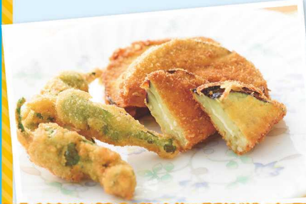
杉谷なすびと杉谷とうがらしのフライ