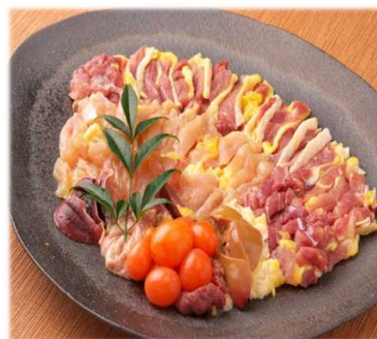
近江しゃものお肉