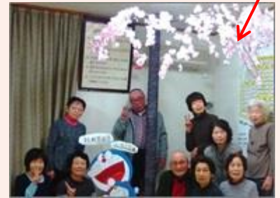
共同制作した桜の花