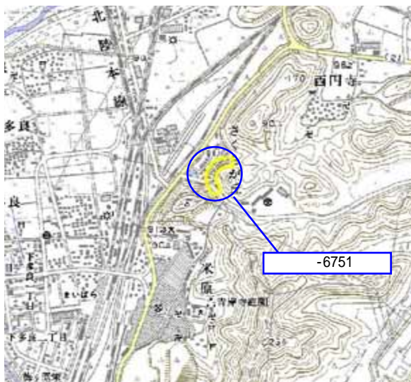
土砂災害警戒区域・土砂災害特別警戒区域 位置図