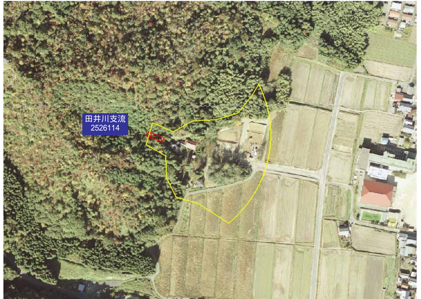
土砂災害警戒区域図

・この地図は、国土地理院長の承認を得て、同院発行の数値地図25000(地図画像)を複製したものである。(承認番号 平16総複、第205号)