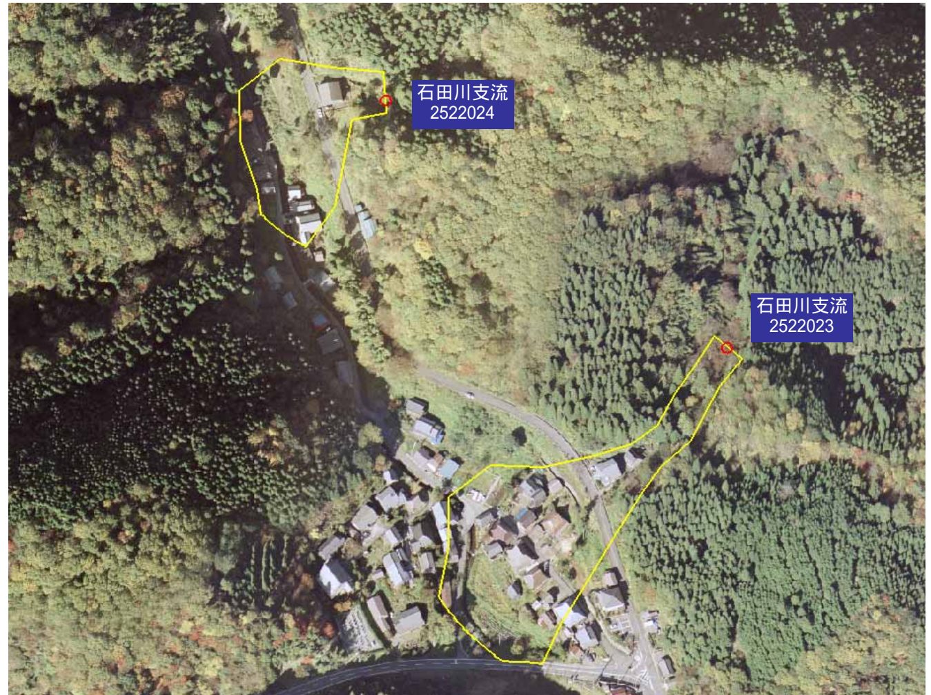
土砂災害警戒区域図

・この地図は、国土地理院長の承認を得て、同院発行の 数値地図25000(地図画像)を複製したものである。(承 認番号 平16総複、第205号)