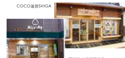
COCO滋贺SHIGA 野洲的大叔饭团食堂

“COCO滋贺SHIGA”销售着县内的著名商品,“饭团食堂”则提供美味的现捏饭团,以满足当地民众为第一宗旨,汽车销售公司迈出的新尝试营造出一道明媚的风景,为城市赋予新的生机与活力!