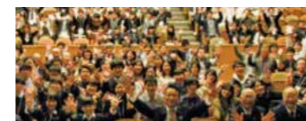
第2届校园SDGs琵琶湖大赛 2019年11月16日

除了培养肩负实现SDGs目标重任的人才,为建设可持续发展地区提供支援外,还通过举办滋贺县内外相关人士参与的“校园SDGs琵琶湖大赛”等活动,力争将滋贺县立大学打造成为SDGs地区化的基地。