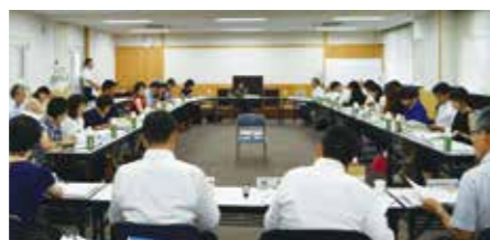
滋贺县基本构想审议会