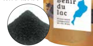
湖之惠(Bénir du lac)

琵琶湖水草覆盖湖面,既影响景观美化,又产生恶臭,为了改善日益严峻的水草问题,我们将有效微生物加入到水草中,作为有机特殊肥料实现产品化,在促进社会循环的同时,其部分销售额还被用来作为琵琶湖环境保护的费用。